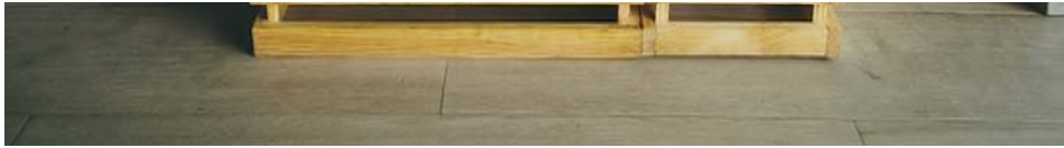
ParmesanMill_Or: MCSA09_def Detalle